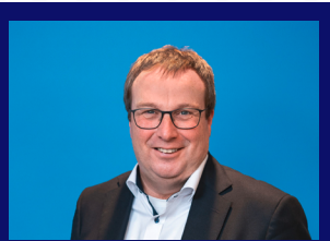
Oliver Krischer Minister für Umwelt, Naturschutz und Verkehr Nordrhein-Westfalen