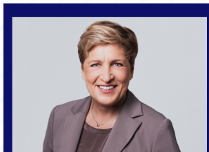
Nicole Razavi MdL Ministerin für Verkehr Baden-Württemberg